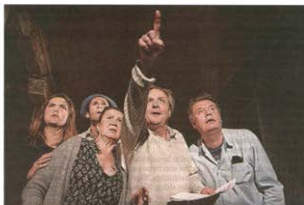
En scen från Apelsinträdet och året 1957 när Sovjetunionen skickat upp sin första Sputnik.

Apelsinträdet beskrivs som en folkhemskronika som gör nedslag ett antal år - 1936, 1944, 1957, 1963, 1968 och 1984 - och då vävs historiska händelser in. 1944 pågår andra världskriget, 1957 sköt Sovjetunionen upp sin