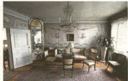
ORIGINAL. Den gamla salongen står som ett museum över 1700-talets herrgårdsmiljö i rokokostil.