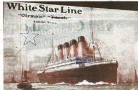
Reklamkort för rederiet White Star Line, som fortsatte att användas efter fartygskatastrofen. Man strök helt enkelt bara över namnet Titanic.

västerut, 25 procent av landets befolkning. Detta gjorde bland annat att Chicago blev den näst största svenska staden, alltså med svensktalande invånare. Fler än i Göteborg.