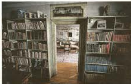
SKILDA VÄRLDAR. I biblioteket står Magnus Wetterholms morföräldrars böcker och bilder. I gamla salongen finns originalmöblerna från 1700-talet.