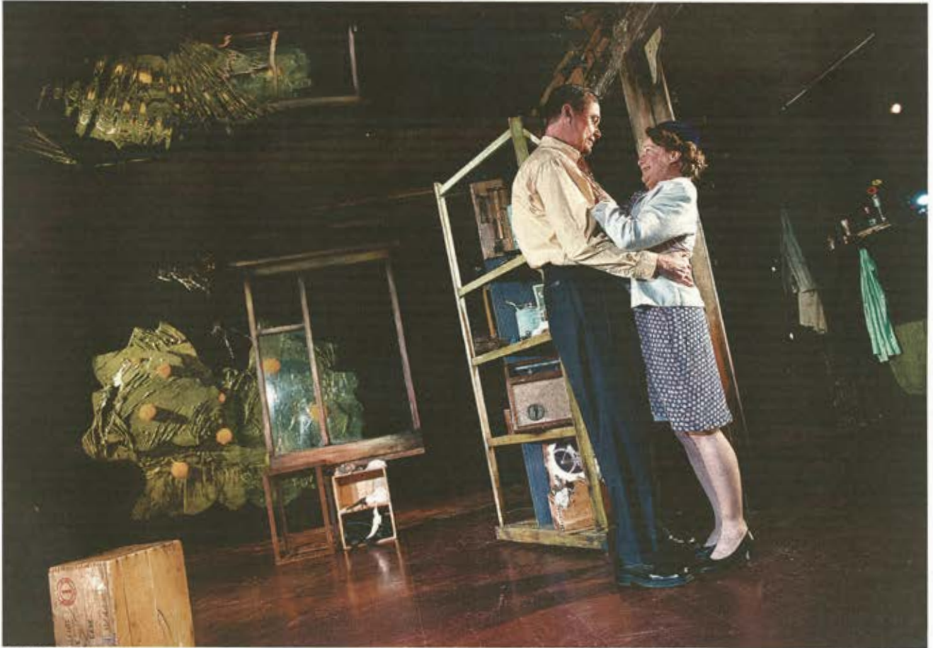
OJÄMNA SKÅDESPELARINSATSER. NA:s recensent tycker att de professionella skådespelarna är bra, men insatserna från de icke professionella är svajiga. Betyget blir dock ändå fyra stjärnor.