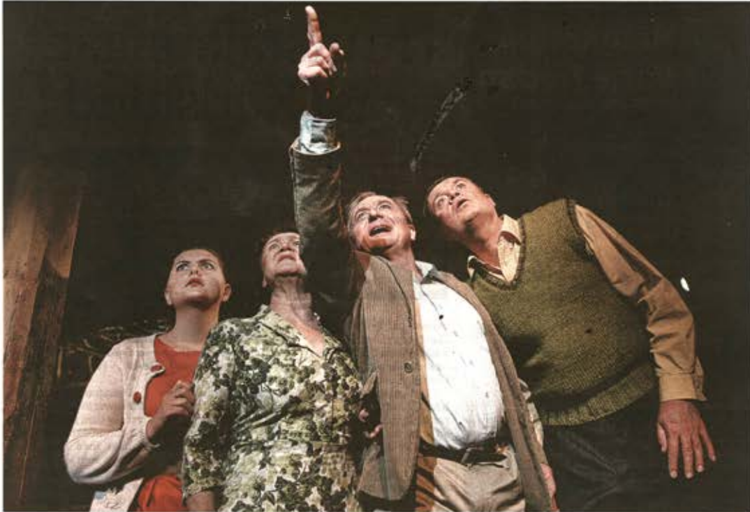
FRAMTIDSTRÖ. När ryssarna skickar upp sin sputnik i himlen är framtidstron så påtaglig att den nästan går att ta på för familjen och vännerna i Henning Mankells föreställning "Apelsinträdet".