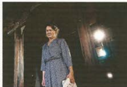
"APELSINTRÄDET". Henning Mankells "Apelsinträdet" är årets föreställning på Stadra teater.

"Apelsinträdet" utspelar sig runt familjen Karlsson från "en lördagseftermiddag i augusti 1936 till en oktoberdag på åttiotalet", som Henning Mankell själv beskrivit det. Mannen i familjen, Axel, och hans vän Oscar Sundin är socialister och vill till Spanien för att strida för det spanska folkets skull. Oscar drar i väg, medan Axel stannar hemma. Flickvännen Karin väntar barn och Axel erbjuds ta över en cykel-