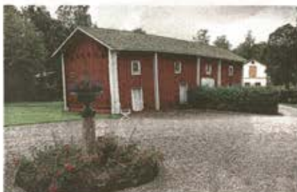
ÄLDSTA HUSET. Magasinet är från 1600-talet och rymmer i dag en del av kostymerna till teatern på Stadra.