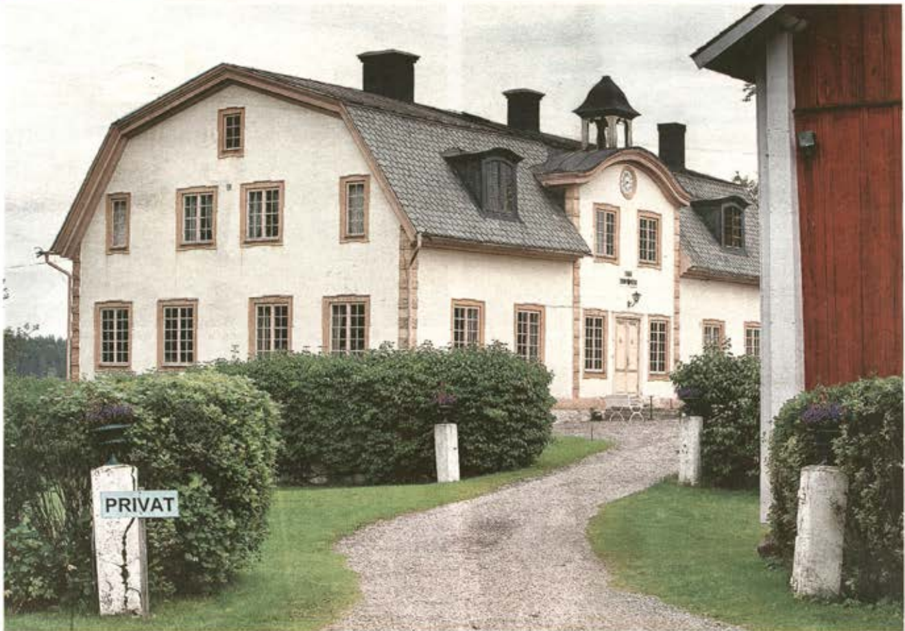
EXTERIÖR. Stadra herrgård fick sitt imponerande yttre utseende i samband med en större renovering 1901.