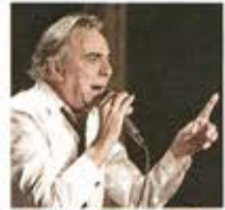
Rikard Wolff gästade Stadra Teater första gången 2003 och helgens föreställningar bokförs som hans åttonde år i Stadra.

SÅSONGSSLUT. Rikard Wolff satte i söndags punkt för Stadra Teaters sommarsäsong. Intresset för denne skådespelare, sångare, estradör och publikdomptör är så stort att det inte räcker med ett framträdande för att stilla efterfrågan.