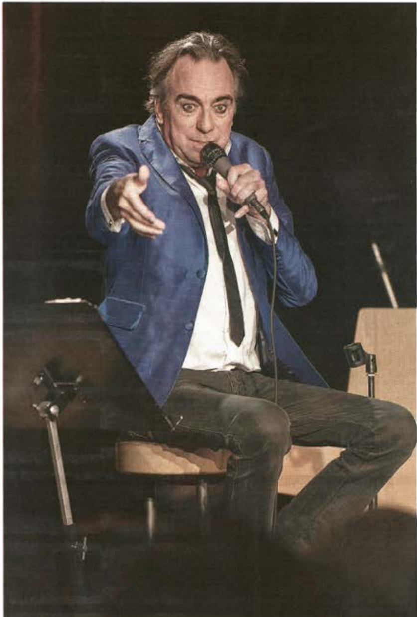
Rikard Wolff satte i söndags punkt för Stadra Teaters sommarsäsong.

Häromåret spelade han Karl Gerhard på Stockholms stadsteater vilket raskt leder till Den ökända hästen från Troja och en dräplig berättelse om hur det gick till när han hamnade på Södersjukhusets akut där ena benet fick sys med 45 stygn. "Kanske lite musik, vad sägs om Brels Amsterdam. Visst, det