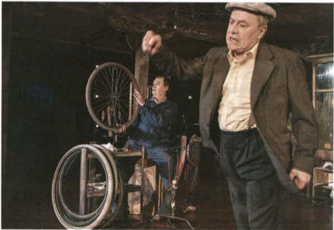
Oscar (Magnus Wetterholm) ska åka till Spanien och kämpa mot Franco och vill ha med sig Axel (Rune Jakobsson).

Det börjar med att Oscar rusar in i den cykelverkstad där Axel arbetar. Oscar har fått sparken efter att ha skällt ut en friherre