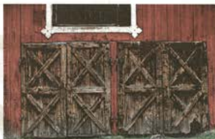
STORT ANSVAR. Att äga en gammal herrgård innebär ett stort ansvar för att byggnaderna ska bevaras till eftervärlden.